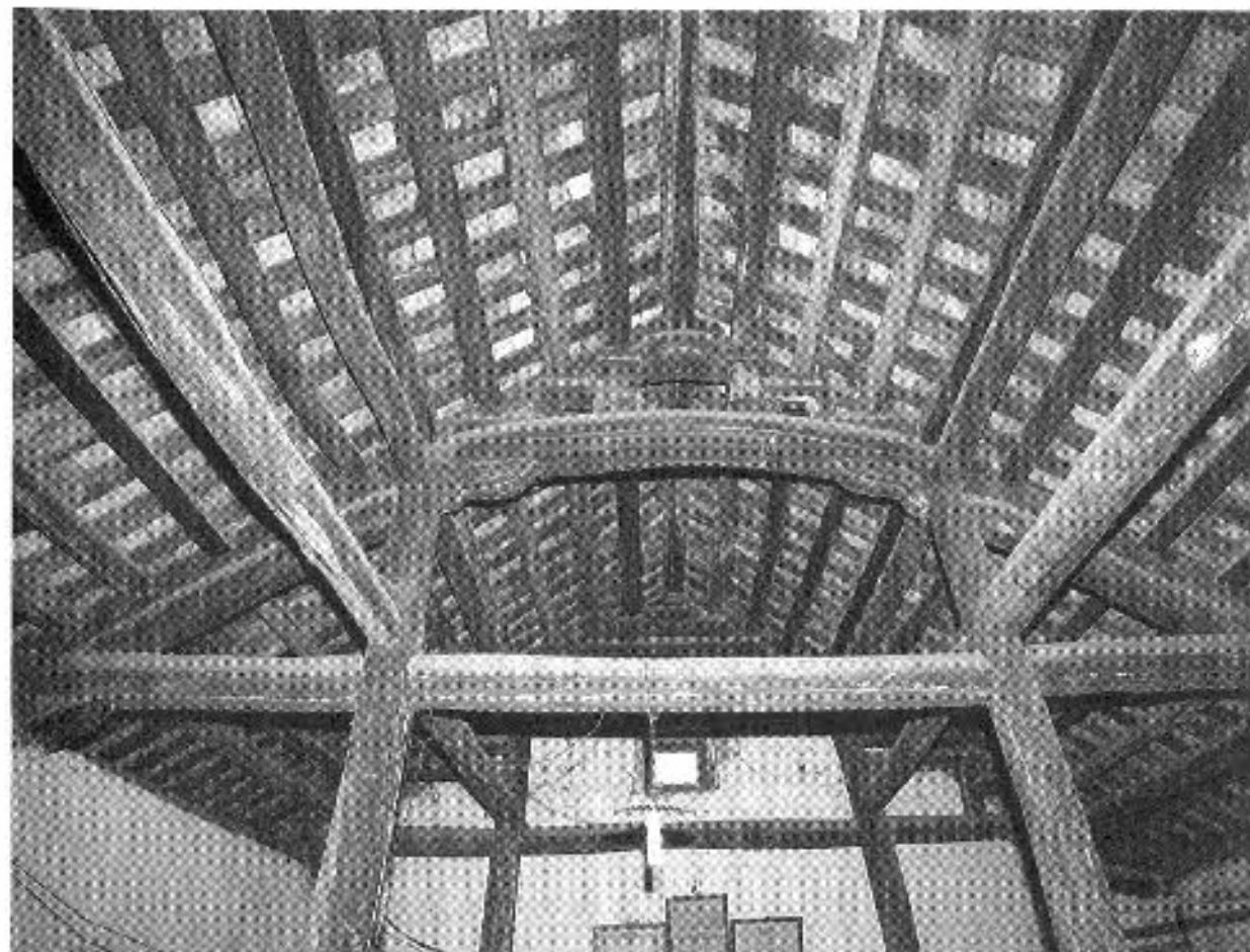
図26 モンフーⅢ-105宅の主屋内部(嗣徳10年=1857)

20世紀初頭以前の伝統形式は、軸部・小屋組とも木造で、背面および側面を石材やレンガで壁をつくる。間口は5間もしくは7間で、中央3間を主室、両脇間各1間ないし2間を側室とする。奥行1間の身舎の前後にそれぞれ庇・孫庇を葺き下ろして切妻造の屋根をつくる。正