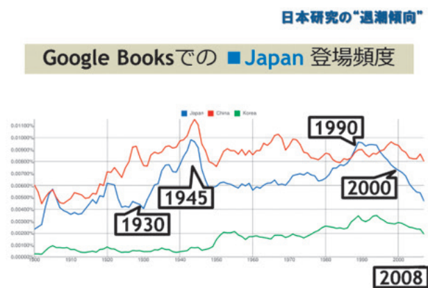
図1 Google Books での「Japan」登場頻度

図1は、Google 提供のサービス「Google Books Ngram Viewer」( http://ngrams.googlelabs.com/ )を使って描いたもの 1) で、キーワードを指定すると、Google Books内の書籍本文中にそのキーワード