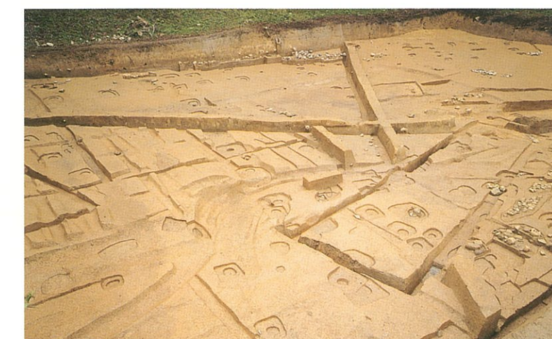
掘立柱建物群（南西から）