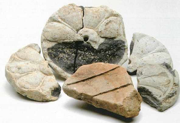
出土した瓦と鴟尾