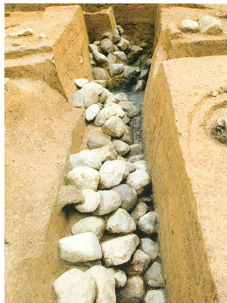
石垣南半（北西から）