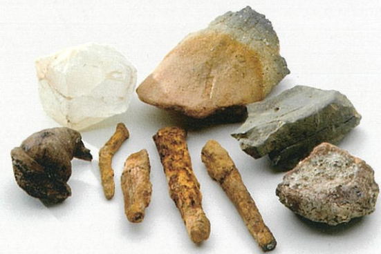
生産関係品と鉄器