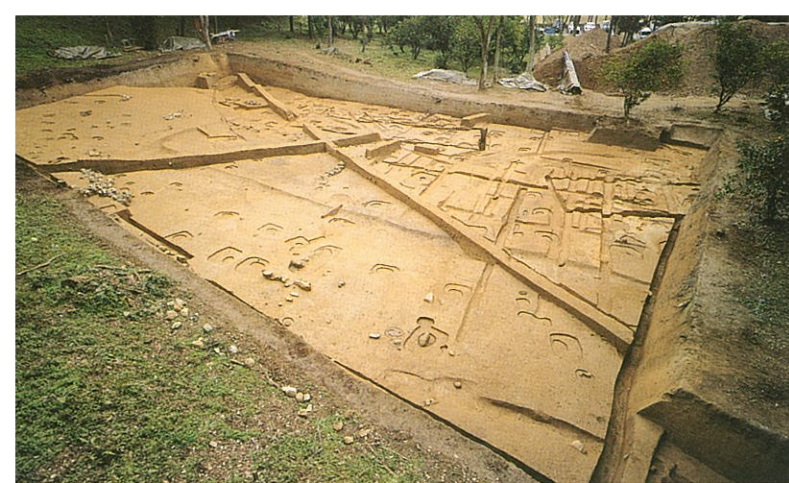
調査区全景（北西から）