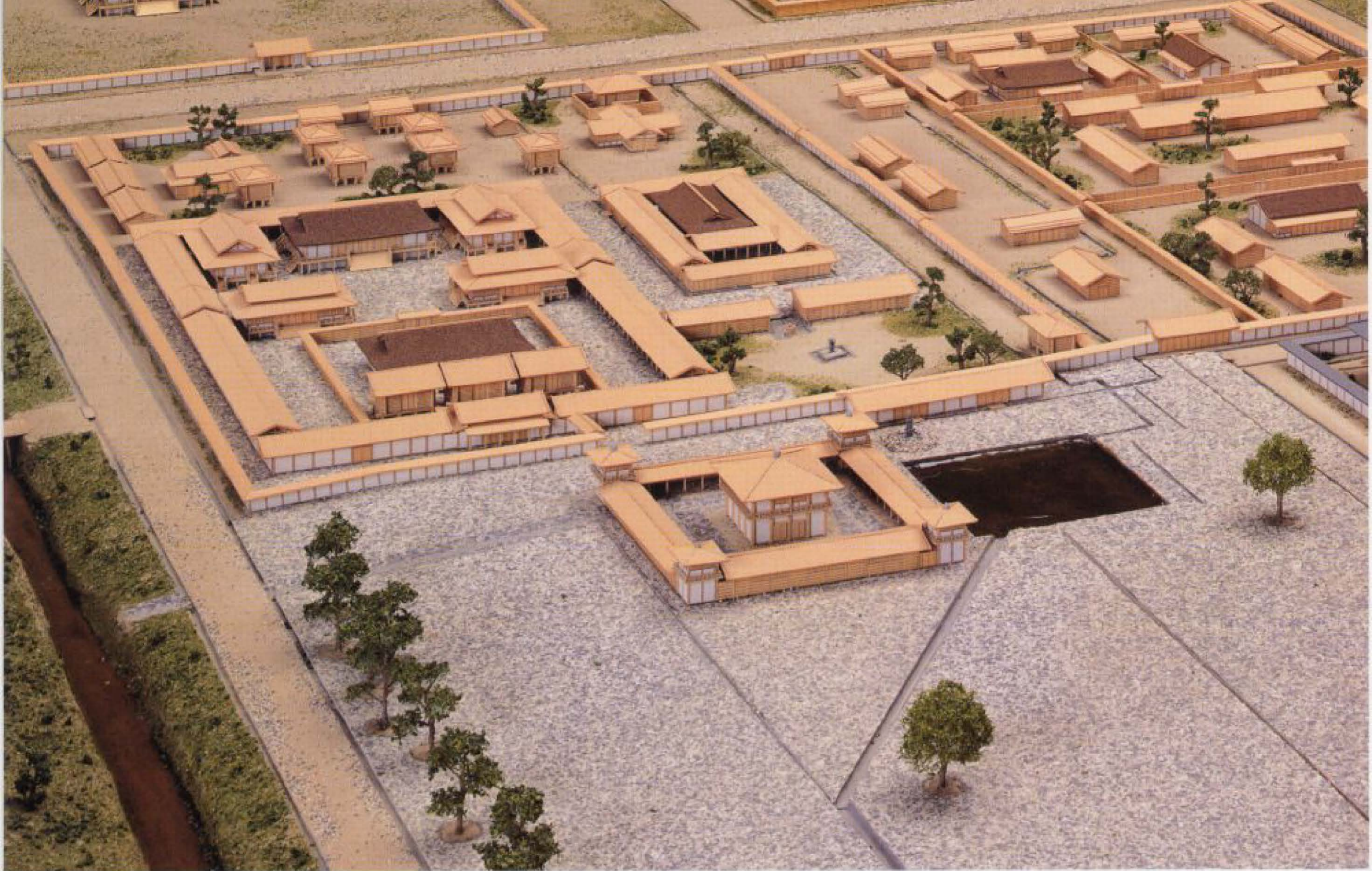
石神遺跡・水落遺跡復元模型（南西から）

斉明朝の姿を、調査成果に大胆な推測を加えて復元しました。手前(南)が水落遺跡の漏刻台(水時計台)、奥(北)が石神遺跡で、西側の広い区画を迎賓館、東側の区画と石敷広場を饗宴の場としました。