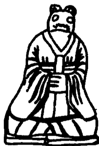
図44 兩湖型(咸嘉湖墓)

両湖地区 長江中流域の湖北・湖南両省を中心とする地区。獣頭人身像は、隋・開皇3年(583)前後には出現していた可能性があり、8世紀初頭にかけて盛行する。中国において最初に獣頭人身像が出現した地区である。隋・大業年間(605~616)までのものは、それぞれ個性的であるが、拱手した首の短い座像、腹部にたて帯が垂下する、などの共通する特徴