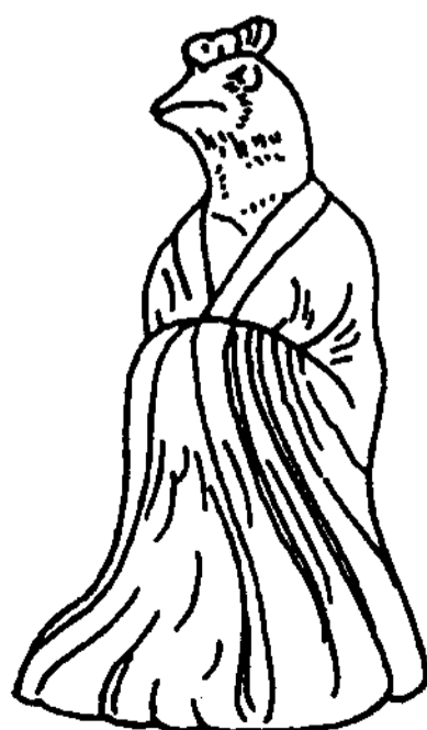
図45 揚州様式(司徒廟鎮墓)

揚州地区 長江下流域の揚州を中心とする地区。獣頭人身像の初見は、7世紀中葉の陶典墓例で、長く伸びた首を特徴とする無笏の座像である。無笏の座像という点は7世紀前葉の両湖地区のものと同通する。その影響を受けて本地区の獣頭人身像が出現したのであろう。つづく7世紀後葉から8世紀初頭の楊廟墓、司徒廟鎮墓、高郵車邏墓例はそれぞれ個