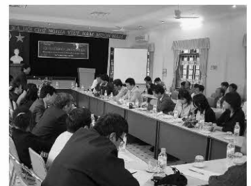
図10 現地ワークショップ