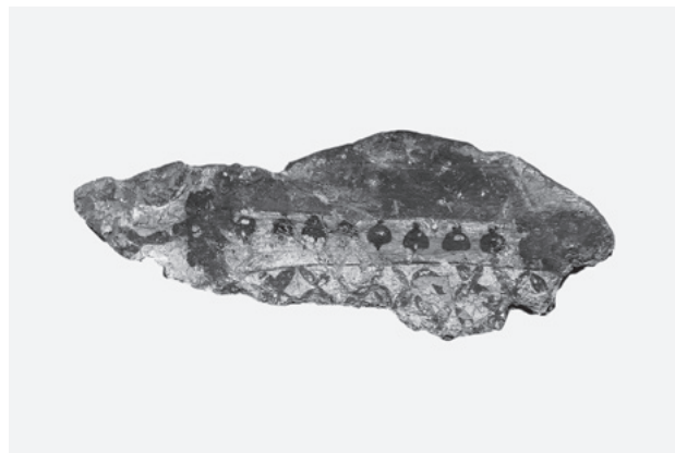
図14 表面クリーニング後の壁画断片4