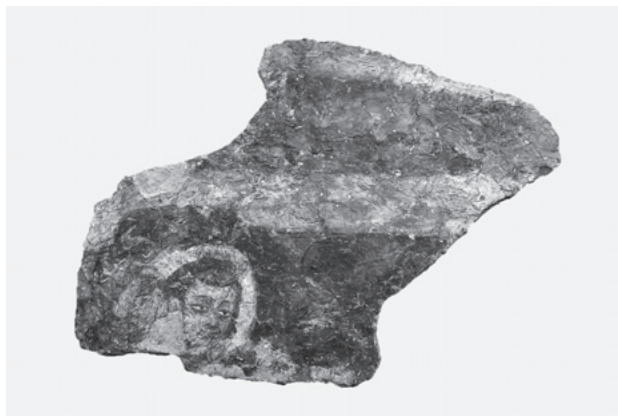
図11 表面クリーニング後の壁画断片1

Pidaev, Sh., T. Annaev, G. Fussman, Monuments buddhiques de Termez I: Catalogue des inscriptions sur poteries par G. Fussman, Paris, 2011.