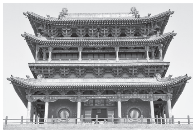
図5 中国山西省平遥古城北城門楼阁