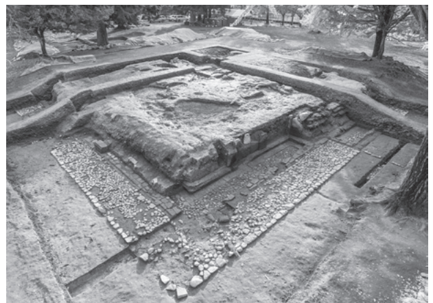
図294 2区全景 (北東から)