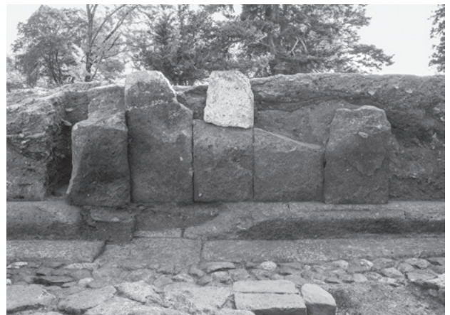
図293 創建塔基壇北縁辺部東半の基壇外装 (2区、北から)