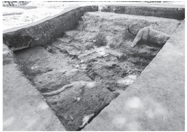
図291 創建塔・再建塔の南面階段東端部 (4区、南東から)