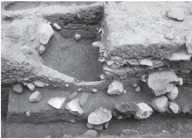
図289 再建塔礎石抜取穴直下の環状石列 (2区、南から)