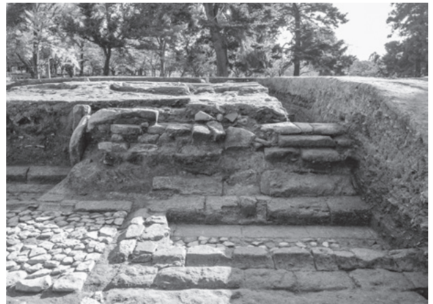
図292 創建塔の北面階段東半 (2区、北から)

模などを詳細に検討するためのデータを得た。また、特に階段の規模や構造は塔初層の柱配置と対応することが想定されることから、創建塔初層の柱間寸法や規模について、現状では中央間のみ12尺で他の柱間を10尺とする5間(52尺)四方と推定している。ただし、これについては建築史学など多方面からの検討を加味して考察を深める必要があり、詳細は今後の報告に委ねたい。