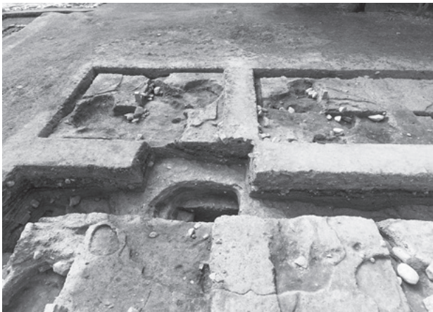
図290 塔心礎抜取穴 (2区、東から)