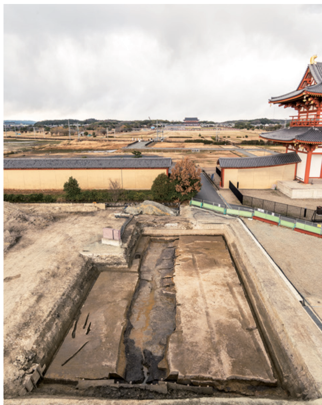
平城京朱雀大路・二条大路の調査（平城第578次）

朱雀大路西側溝が二条大路を横断することを確認し、朱雀大路西側溝の東岸に3か所の張出を検出した。類例がなくどのような機能をもっていたかは断定できないが、橋と何らかの関係がある遺構の可能性も考えられる。南から。本文190頁参照