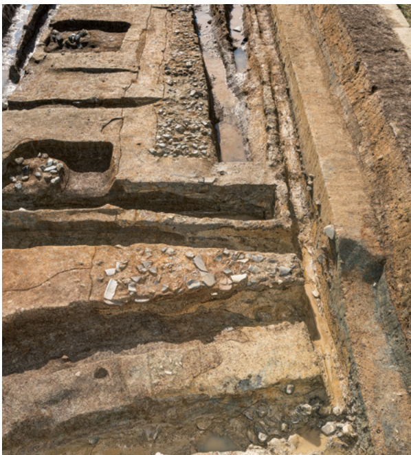
東面南回廊の内庭側の遺構検出状況

東面南回廊の内庭側では、基壇外装据付溝・抜取溝と礎敷が良好な状態で検出できた。北から。