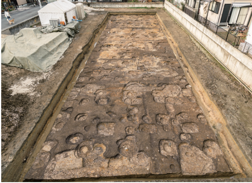
平城京左京二条二坊十一坪の調査 (平城第563次)

調査地は東院庭園の南東に位置する。既往の調査では奈良時代の大型掘立柱建物2棟(SB6950・6990)の東妻を検出していた。本調査区ではそれらの西方に続く同一の東西棟掘立柱建物を2棟確認した。南から。