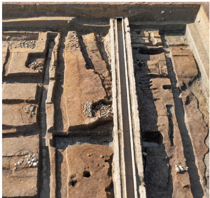
東門と東面南回廊との取付部

東面南回廊の内庭側では、基壇外装据付溝・抜取溝と礎敷が良好な状態で検出できた。北から。