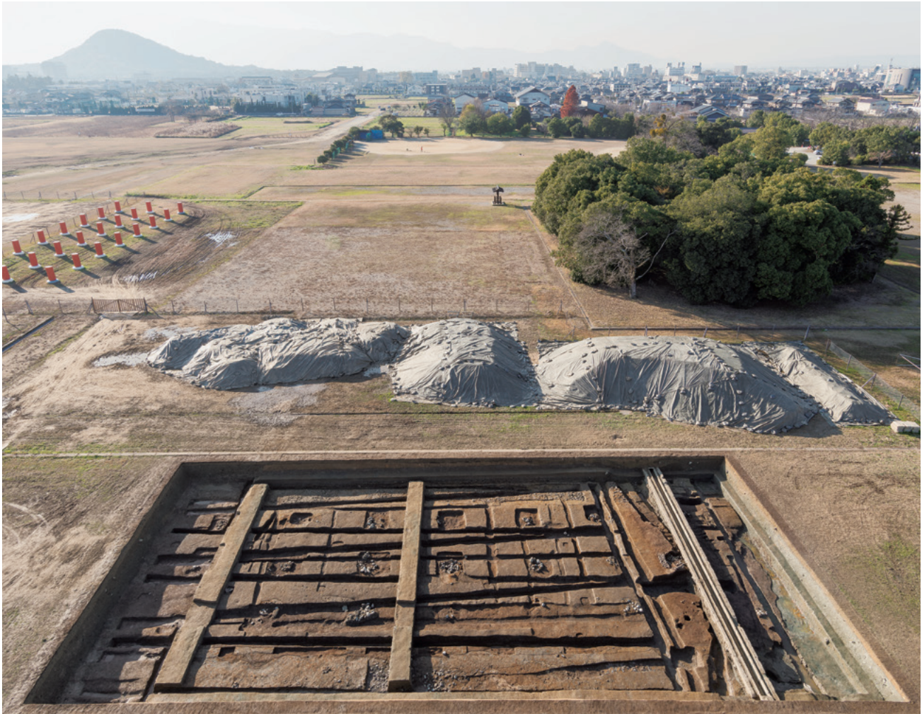
藤原京大極殿院の調査（飛鳥藤原第190次）

調査地は大極殿院東門と東面南回廊にあたる。東門の南端となる3基の礎石据付穴を確認した。また、東面南回廊の礎石据付穴と根石、基壇外装据付溝と抜取溝、雨落溝を検出した。東から。