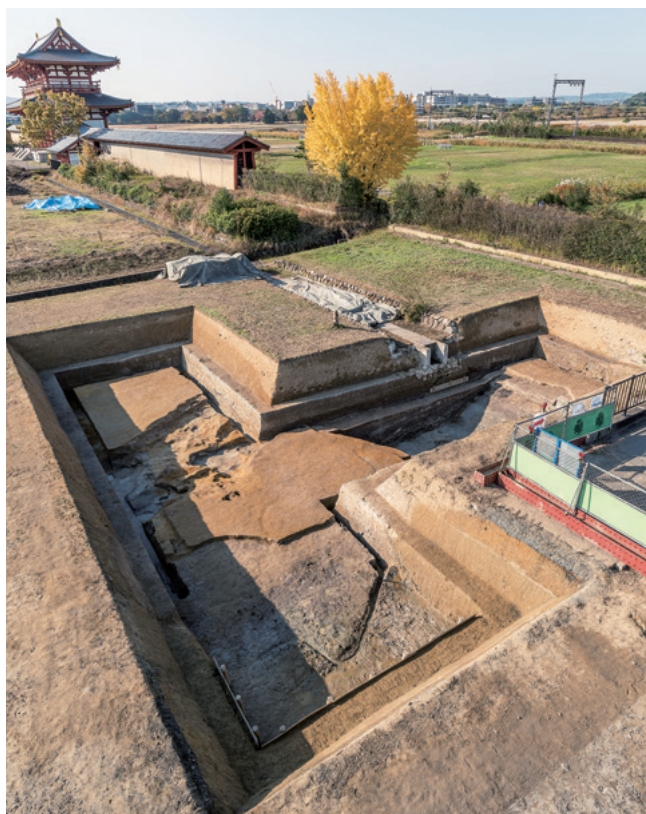
平城京二条大路東一坊域の調査（平城第576次）

調査地は朱雀大路およびその西側の平城京右京三条一坊二坪にあたる。本調査では、杭列をともなう朱雀大路西側溝およびその西側に隣接する築地塀の基礎が検出された。南西から。本文190頁参照