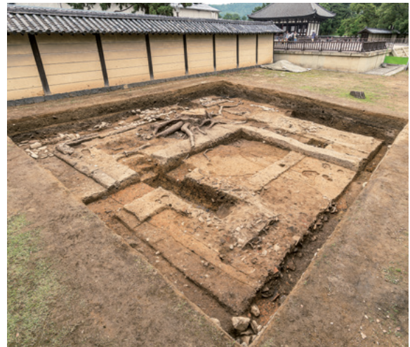
興福寺南大門西門守屋の調査 (平城第567次)

南大門の南西で、西門守屋の基壇外装やその抜取溝などを検出した。西門守屋が東門守屋とほぼ対称の平面形態であることが判明し、建物の廃絶時期についても見通しが得られた。右奥は南大門の復元基壇。南西から。