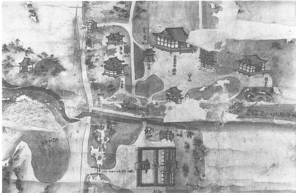
Fig.2 薬師寺絵図・部分

江戸時代には、寛永2年(1625)八幡神社中門修理 69) 、同17年八幡神社社殿修理 70) 、慶安3年(1650)に現南門を移建 71) 、万治3年(1660)には文殊堂を西塔跡に移建 72) 、延宝2年(1674)には鐘楼建立と東院堂の修理があった 73) 。元禄12年(1699)の『薬師寺現前諸伽藍并神社覚』によると、金堂・東塔・東院堂・文殊堂・鐘楼・大門・脇門・西院不動堂・同弥勒堂・仏餉屋・鎮守八幡宮・同回廊・同楼門・八幡若宮・弁才天社・養天満社・竜王社・天神社が見える。その他、江戸時代初中期の寺蔵古図3種及び『大和名所図会』などによって当時の境内の状況が知られる。