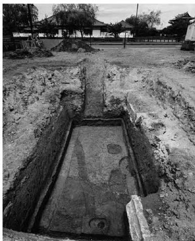
図201 第361次調査遺構検出状況

SA8750は掘立柱で、柱痕が残る。掘形は南北約50cm、東西約30cm、南北に細長い隅丸方形で、規模は小さい。柱痕は径約15cm。約250m北でおこなわれた第242-3次でも奈良時代のものと思われる同規模の掘立柱からなる南北塀を検出している。この塀とは軸線が合わないが、規模、方位から考えても、SA8750は南