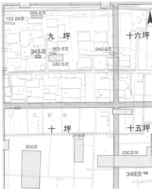
図174 第343次・第349次調査区位置図 1:2000

店舗増築に伴う事前調査である。現在の二条大路北端から50mほど北に入った地点で、左京三条一坊十五坪にあたる。調査区は第230次調査IV区より5m南に位置す