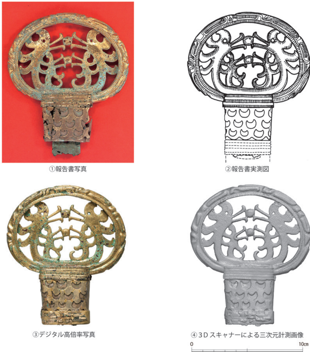
図2 京都府湯舟坂2号墳出土双龍環頭大刀（環頭部分）（S = 1/2）（京丹後市教育委員会所蔵）

とし、ここでは、今回作成した三次元計測画像を既報告書に掲載されている写真、実測図や、栗山氏が新規撮影した高倍率写真と比較してみたい。