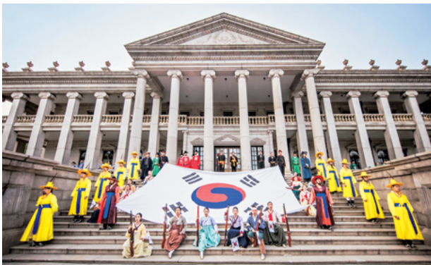
2019年第5回宮中文化の祭典 徳寿宮 時間旅行