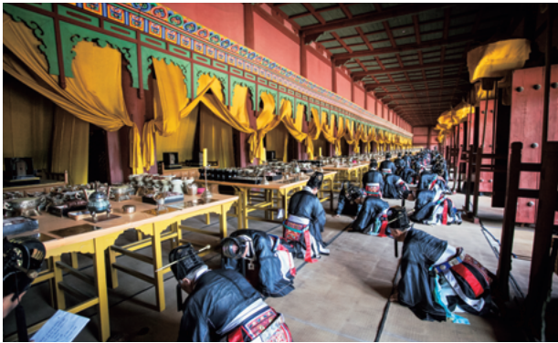
2016年宗廟大祭捧行 (神室)