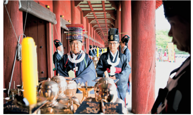
2016年宗廟大祭初献官 (神位に酒を三献捧げる時の最初の杯を捧げる官職 (正1品))