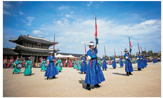
2017年景福宮での宮殿警備兵点検の儀式