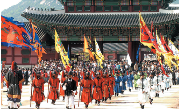
2002年守門將交代儀式