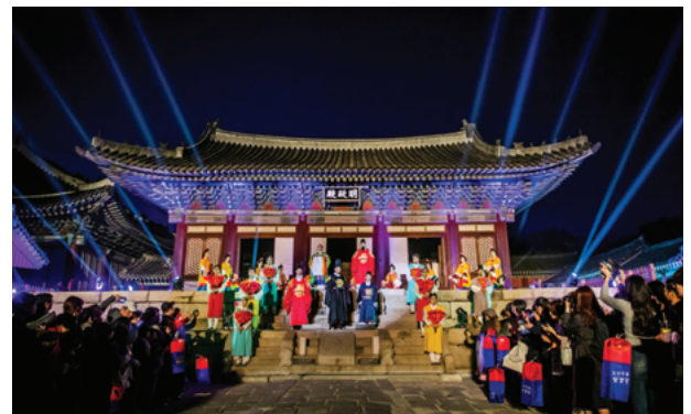
2019年宮中文化の祭典 昌慶宮 時間旅行