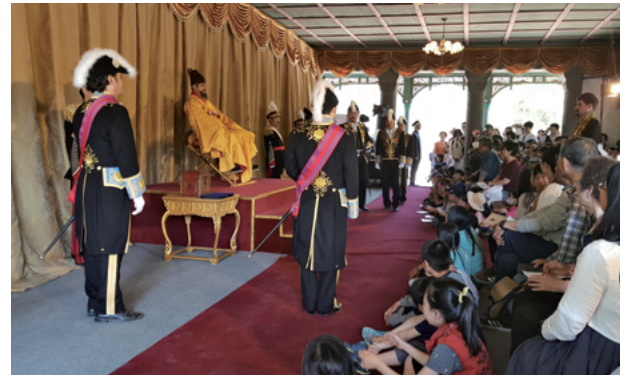
2017年徳寿宮外国公使接見礼再現行事