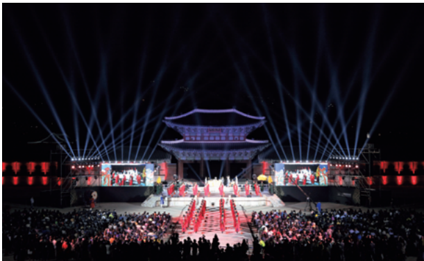
2017年宮中文化の祭典開幕式 (景福宮)