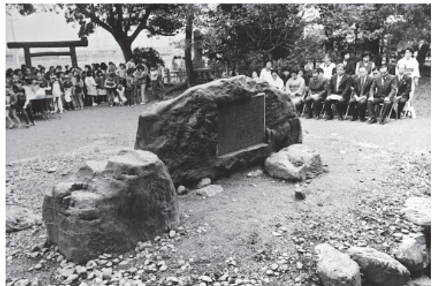
図3 第1回齋王まつり

広場」、平成11年度には、史跡のガイダンスと歴史体験の施設で、平安時代の寝殿造り等をイメージした「いつきのみや歴史体験館」、平成13年度に広大な史跡を視覚的に理解するための史跡10分の1模型を含む「齋宮跡歴史ロマン広場」、平成27年度には、平安時代初期の齋宮寮庁と推定される復元建物三棟を中心とした史跡公園「さいくう平安の杜」(図2)、史跡内を貫通する幅約9mの「古代伊勢道」約350mを復元する整備を県が文化庁の2分の1の補助金を得て行った。