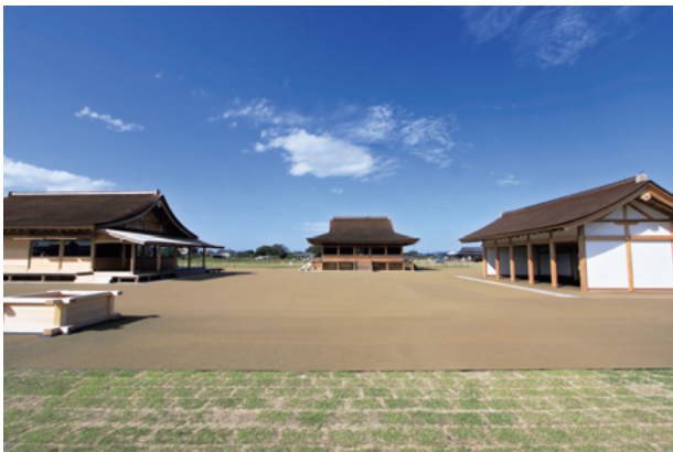
図2 史跡公園「さいくう平安の杜」