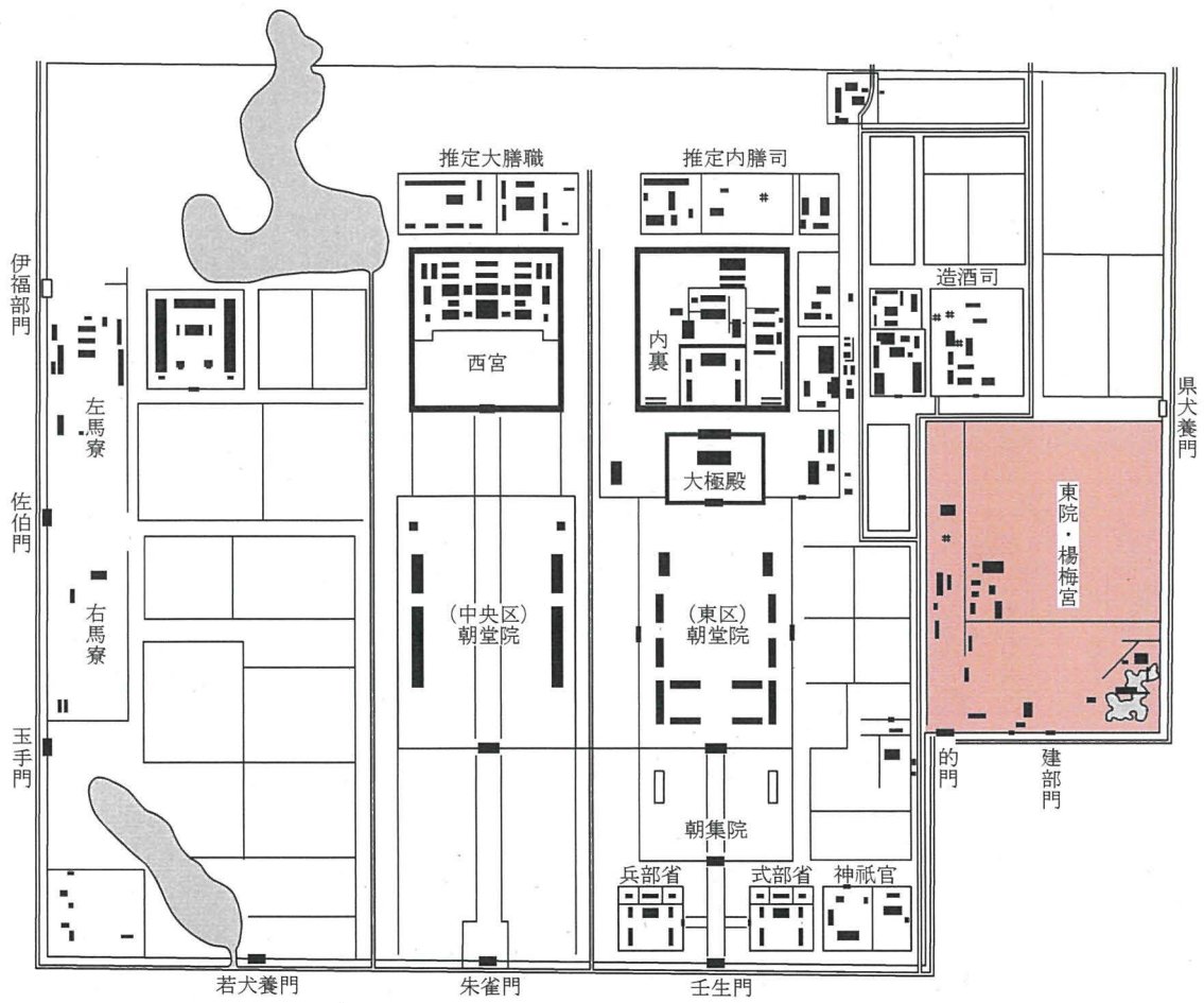
図1 奈良時代後半の平城宮 (井上和人『日本古代都城制の研究』所収図に加筆)