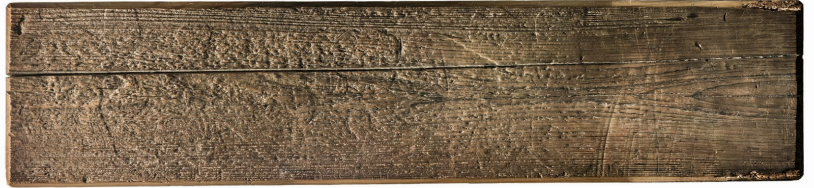
明治 34 年 (1901) の標木 この標木建設が平城宮跡保存の最初の運動でした。