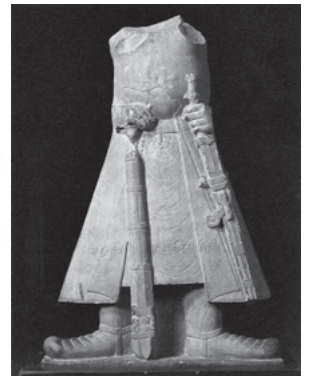
図22 マトゥラー出土カニシカ王像

提案している 6) 。描起図をもとにした研究には限界があり、壁画の公表が急務となっている。