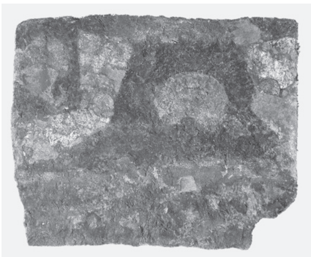
図23 処置後の壁画(断片11)、中央人物の足の部分