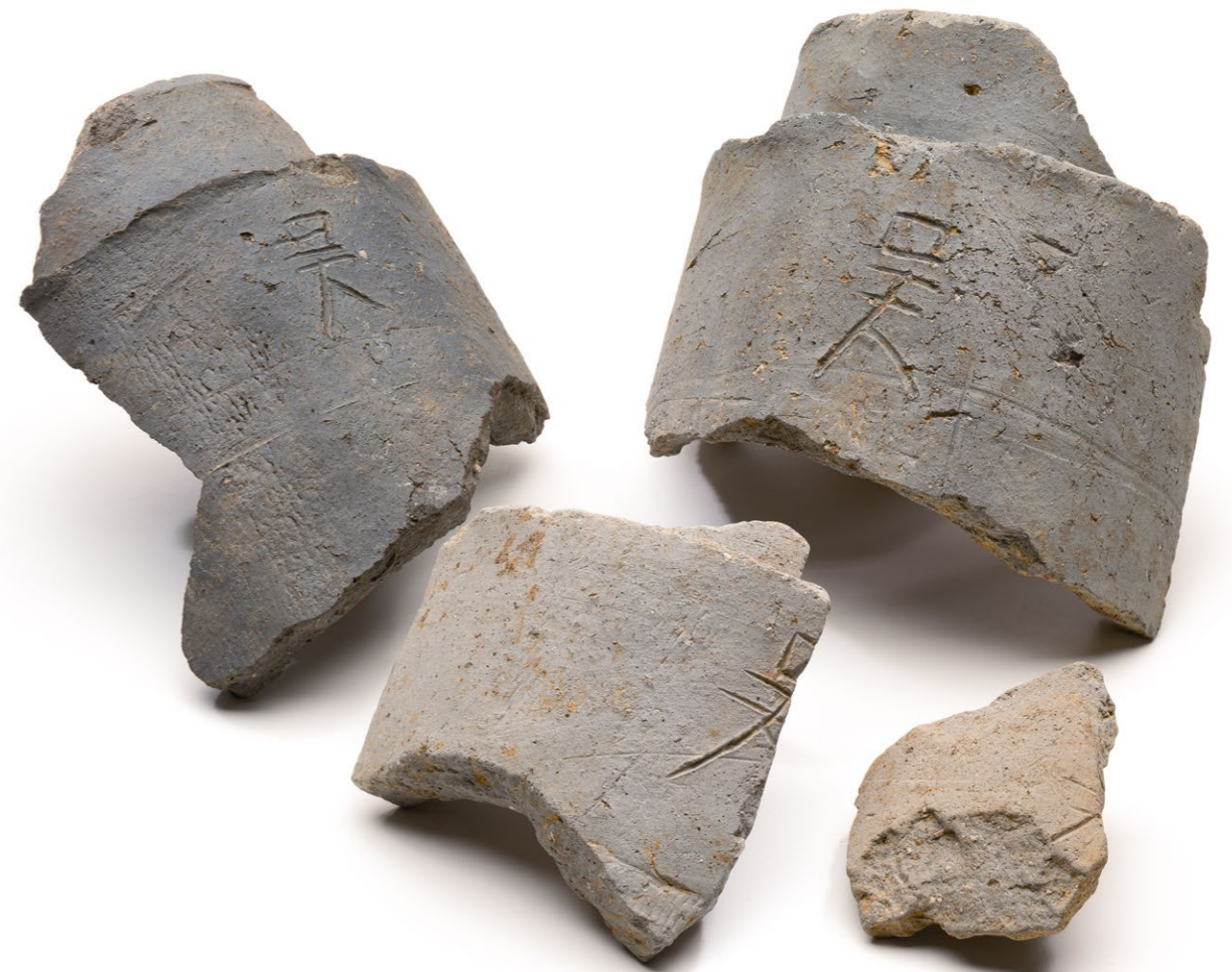
多数確認されている「吳」文字瓦 (右側の3点は飛鳥藤原第164次調査出土)