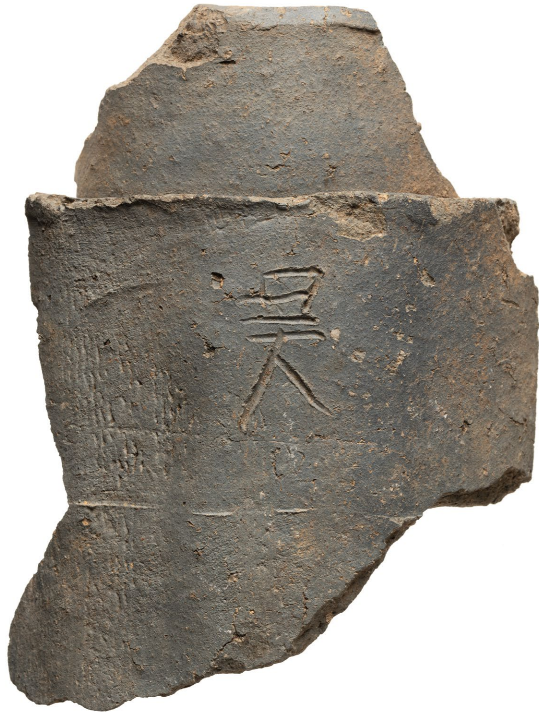
檜隈寺跡付近出土「吳」文字瓦 (原寸大)