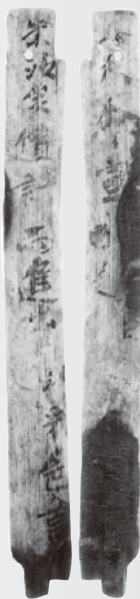
万葉人のとなりには朱沙があった。だから万葉集では赤鼻を朱沙でからかう。

よろずのことのはの集まった万葉集は、木簡と同時代の コトバの宝庫だ。そんな万葉歌を木簡を通じてのぞくと、 新しい魅力が見えてくるかもしれない。