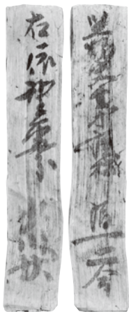
全面にわたってゆったりと流れる筆遣い。木に馴染んだ筆の感触が伝わる。