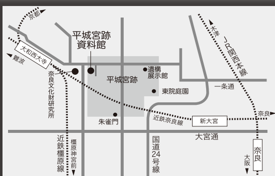
近鉄大和西大寺駅から徒歩10分