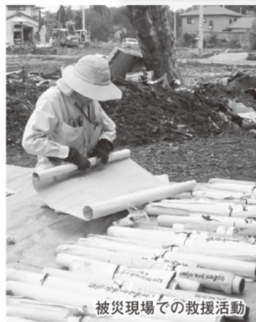
被災現場での救援活動

昨年3月の東日本大震災では、文化財も甚大な被害を受けました。奈良文化財研究所は、他の機関と連携し文化財レスキュー事業に尽力しています。被災地での状況やこれまでの救済活動をふり振り返り、現在も引き続きおこなっている被災文化財の保存処理についてご紹介します。