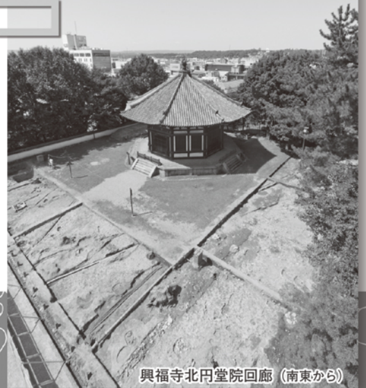
興福寺北円堂院回廊 (南東から)

床に敷かれた遺構図面の上を歩きながら、実際に発掘現場を探索するような気分で、会場をまわってみてください。