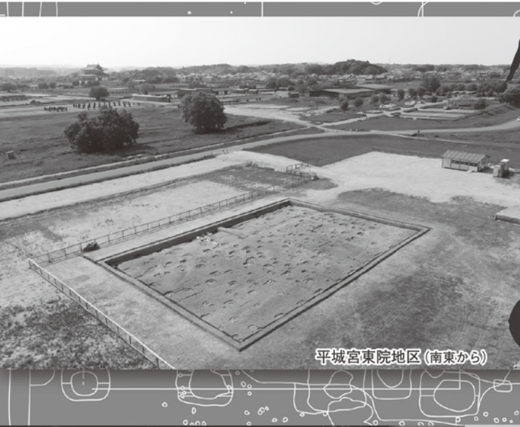
平城宮東院地区 (南東から)