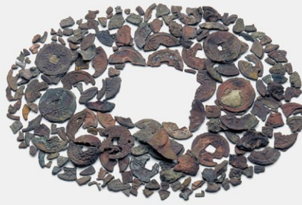
飛鳥池工房遺跡出土 富本銭 (1999年)