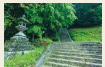
飛鳥川上坐宇須多岐比売命神社