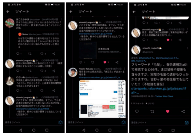
図 16 毛髪の出土例に関するツイート

2019年5月頃、SNSで遺跡での「髪の毛」の出土例について話題となった(図16)。そして返信ツイートで武者塚古墳での「みずら」出土事例が共有された。武者塚古墳をとっかかりに遺跡総覧で当該報告書が特定され、コアな報告事例が共有された。さらに「みずら」が「美豆良」で検索ワードが拡張され、網羅的な検索になったものの、人物埴輪の「美豆良」出土例の混入となった。用語が変更され「毛髪」でのワード検索で66件の結果となった。全文検索であるため、この66件から1件ずつ確認し、目的のものであるかは報告書を確認し、選別していく作業が必要となる。