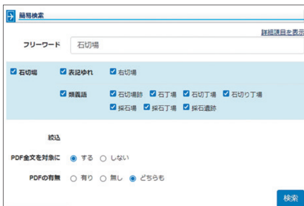
図8 用語の表記ゆれと類義語の自動表示