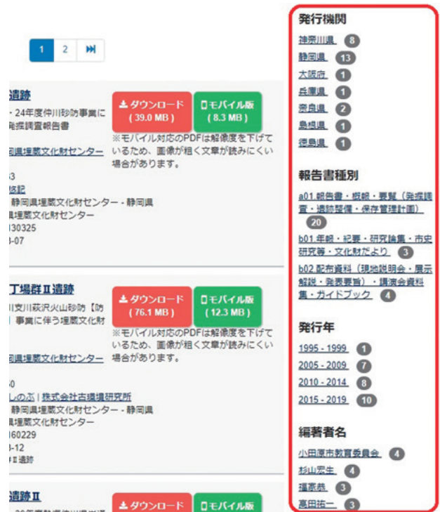
図10 サイドバーで絞り込み検索

機関・報告書種別・発行年・編著者名で絞り込む(図10)。厳密に発行機関所在地=文化財所在地ではないが、日本においては文化財所在地の機関が報告書を発行することが大半であるため、発行機関所在地=文化財所在地と考えてほぼ問題ない。