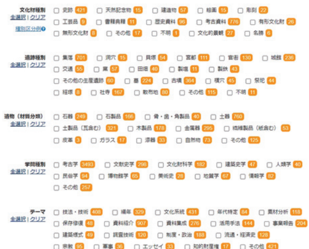
図5 文化財論文ナビの種別やテーマ検索

月11日時点で、書誌は112,806件（発行機関数1,859機関）登録されている。探し方は、4で詳述する。